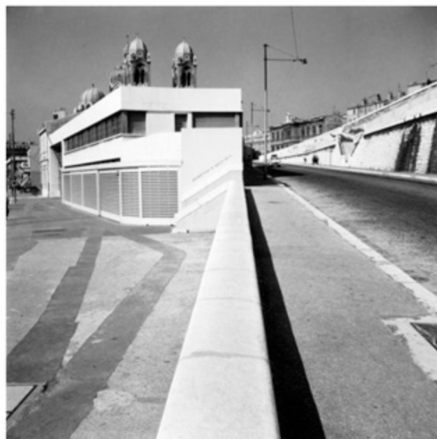
Station sanitaire - vers 1948